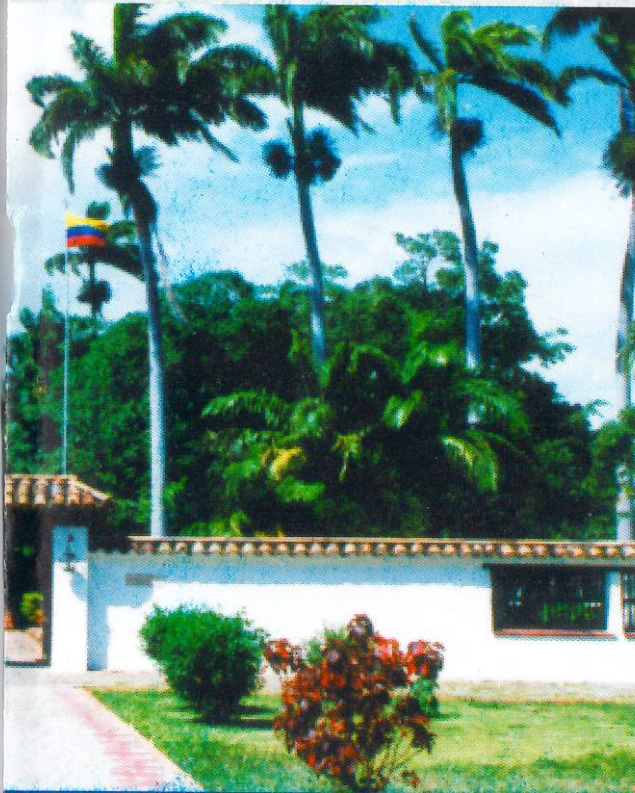
RESIDENCIA DEL PRÓCER Y LIBERTADOR DE COLOMBIA, FRANCISCO DE PAULA SANTANDER, ORIUNDO DE CÚCUTA

LA CONSTITUCIÓN DE ANGOSTURA AUTORIZABA AL JEFE DEL EJECUTIVO PARA “RECHAZAR” SENTENCIAS DEL PODER JUDICIAL (TIT. VII, SECCIÓN TERCERA, ARTS. 15, 16). EL SENADO ERA VITALICIO (TIT. VI, SECCIÓN TERCERA, ART. 2º). EL PRESIDENTE INVOLABLE (TIT. VII, SECCIÓN QUINTA, ART. 1º). LOS CIUDADANOS TENÍAN EL DEBER DE amar A LAS AUTORIDADES, COMO EN LAS MONARQUÍAS ABSOLUTISTAS (TIT. I, SECCIÓN SEGUNDA, ART. 3º).